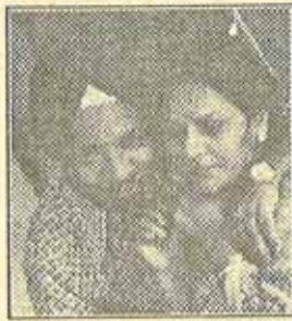
Marriage Magic :

Nashikities on the special ingredients that go into the making of the ultimate in togetherness..... a happy marriage !