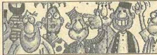
Network's 'Most Memorables'